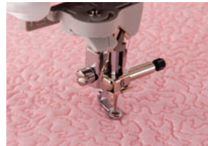
Tikkajalka "C" Suoraommatsetuviointiin

Koneen tarvikkeissa kolme uutta paininjalkaa käsivaraiseen ompeluun sekä lankateline kahdelle suurelle lankakartiolle: