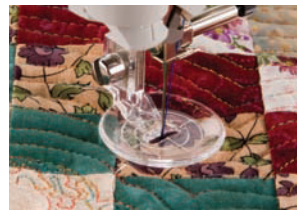
Kaikutikkajalka "E" Kaikutikkauksen tasaleveillä väleillä ommeltavien suoraommatsetuiden ompeluun