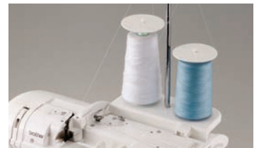
Lankateline kahdelle suurelle lankakartiolle Helposti koneeseen asetettava teline kahdelle suurelle lankakartiolle tai kaksoisneulalla ompelua varten